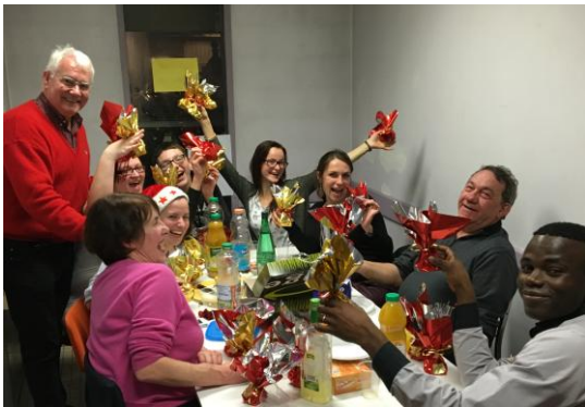
2015 l'atelier théâtre fait la fête

L'assemblée générale du comité, mercredi 27 janvier sera l'occasion de faire le bilan de ces dix années et pour vous, de rencontrer l'équipe du comité. Elle proposera à tous les participants et aux élus de nouveaux projets ambitieux, de nouvelles perspectives. Nos partenaires présenteront leurs activités, vous pourrez dialoguer avec eux. Vous aurez ainsi une vision globale de l'action du comité.