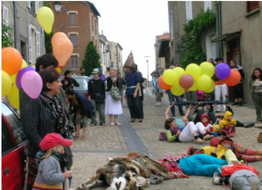
2008 La Fadarria dans les rues

Le comité des quartiers de Montferrand a été officiellement créé en janvier 2006. Depuis, beaucoup de rencontres, d'imagination, de débats, de création. On ne s'en lasse pas, puisque nous constatons une progression dans toutes nos activités.