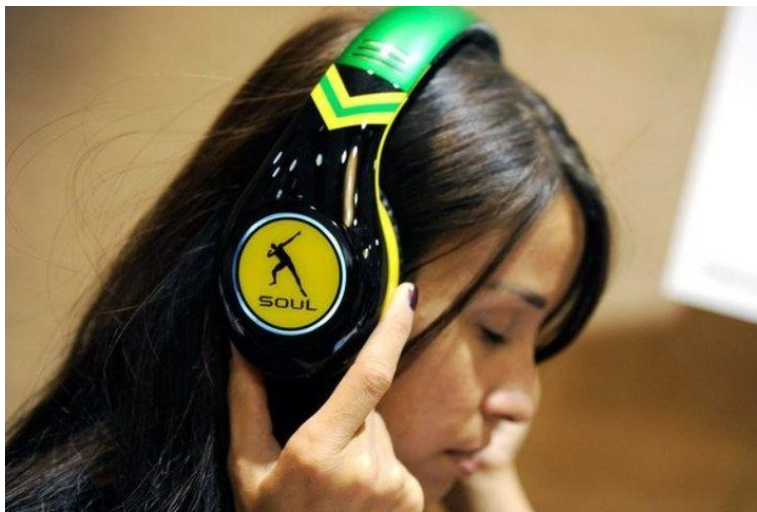
Sortir de son univers pour rencontrer l'autre.

Voyager en bus « low-cost », moyen fréquemment utilisé par la jeune génération m'a fait découvrir l'autre semaine ce que je n'ai que rarement l'occasion d'observer : une jeune fille, assise près de moi, pendant 300 km, a regardé fixement devant elle, comme si ses vertèbres étaient soudées. Pas un regard, pas un mot. Elle était accrochée à son téléphone branché à ses oreilles, comme à une bouée de sauvetage.