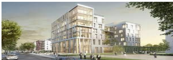
Le Totem rue du Clos-Four

- Une auberge de jeunesse est prévue fin 2019 près de l'hôpital d'Estaing. Avec ses 130 lits, elle pourra accueillir les jeunes touristes et les étudiants venus de France et d'ailleurs.