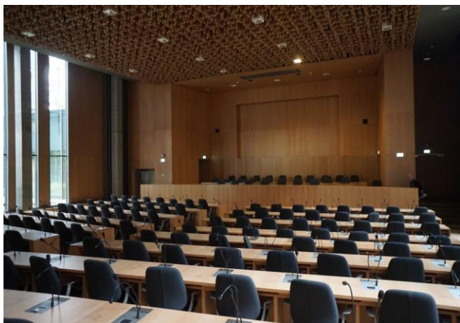
L'amphithéâtre de l'Hôtel de Région

► Samedi 27 janvier , de 14H à 23H30 salle polyvalente du plan d'eau de Cournon la Doume , l'association partenaire pour la monnaie locale du Puy-de-Dôme, l'ADML63 fête son 3 ème anniversaire . Jeux, information, marché de producteurs, restauration, théâtre, buvette, bal folk... Renseignements : contact@adml63.org