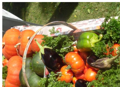
Légumes du jardin partagé de Montferrand

Une équipe de bénévoles emmenée par Pierre Pradalié assure une présence régulière le mercredi après-midi et le samedi toute la journée, suivant le temps. Renseignements : ☎ 06.48.49.51.50.