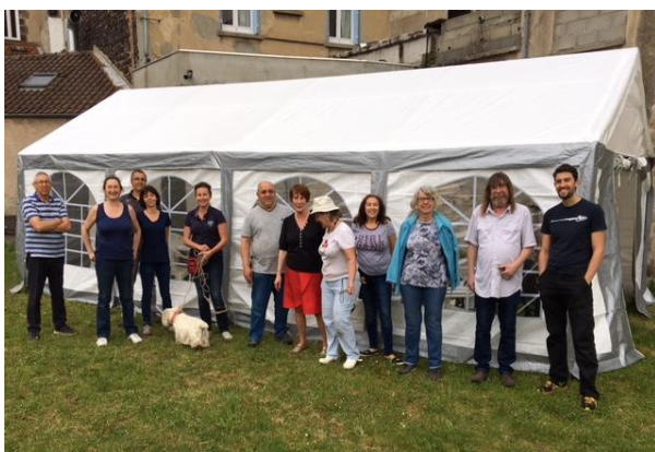
La joyeuse équipe qui a monté le barnum du comité